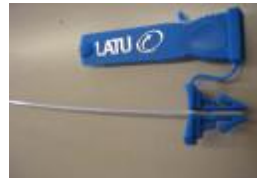
De fleje chato, utilizado en los dispositivos de referencia de las cisternas de camiones tanque.