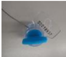
Roll in, utilizados en Taxímetros y Surtidores de Combustibles.