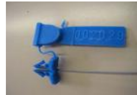
Común, utilizado en camiones cisternas.