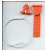
Común, para inutilizar picos por clausura.